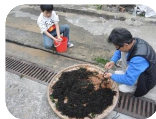
馬灣村曬海草的父子

跟隨著領隊前往馬灣的天后廟，沒有甚麼好風景，沿途只見到一些舊村屋，已經沒有人住了，只留下一條號稱「大街」的鄉間水泥小路和一堆堆斷牆敗瓦，好像是一個荒廢了多年的村落，加上幾隻烏鴉在空中飛翔著，傳來陣陣哇哇的悲鳴，我覺得有些失落感，聞說該批村民搬遷去另一新區居住，這個地段將會發展成為另一柏麗灣似的高尚住宅區。村前空地上有對父子在曬海草，天后古廟的香火裊裊飄搖，似乎訴說這裡曾經的輝煌。