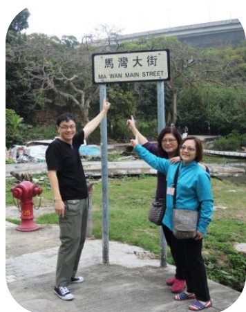
「馬灣大街」是條鄉間小徑

2015年3月14日(星期六)，清晨早上，天陰無雨，正是旅行好時光。原來青馬大橋是世界上最長的公路和鐵路兩用懸索橋。我沒有走上觀景台，因為有很多梯級要走，我被嚇怕了，所以順步走入旁邊的展覽廳。我看到建造橋樑偉大工程背後的故事，令人覺得香港的科技有如此進步。