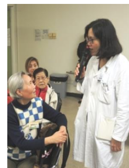
梁醫生與會員聊天