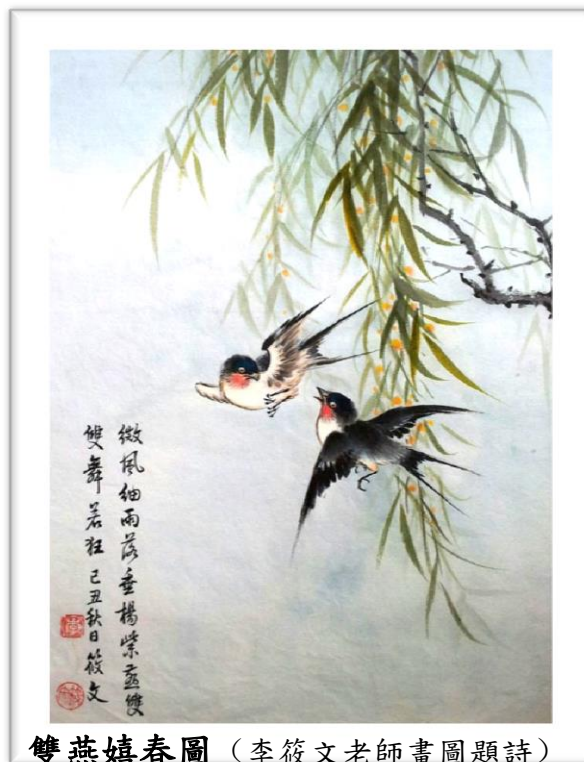
雙燕嬉春圖 （李筱文老師畫圖題詩）