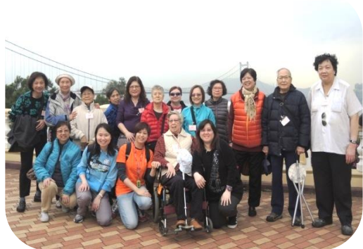
鄭姑娘和區姑娘與健糖會員留影