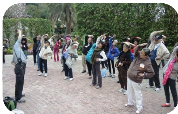
物理治療師帶領病友做運動

午餐後去東涌東薈城逛特賣場。這裡銷售的都是過季的名牌商品，可惜，名牌畢竟是名牌，價格依然昂貴，大家匆匆走過就回家了。短短一日的旅行，會成為我們久久難忘的話題。